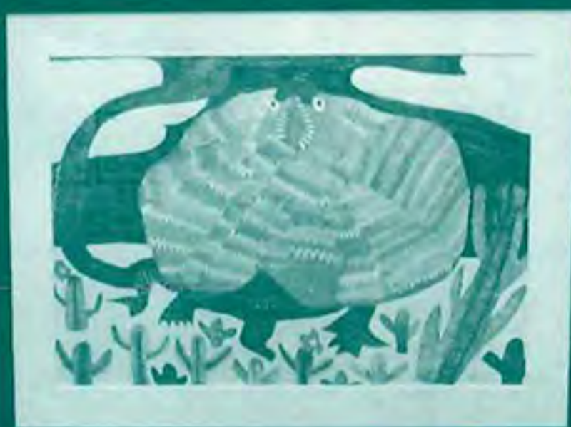
【県福祉協会会長賞金賞】 作品名: エリマキトカゲ 作者名: Y・T(かすが)