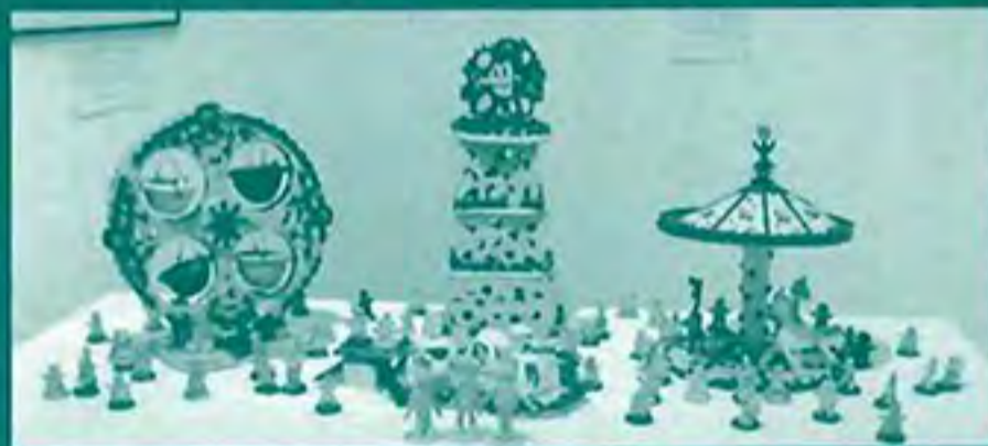
【県福祉協会会長賞金賞(陶芸)】 作品名: みんなで遊ぼう! 作者名: 菊川寮陶芸班(菊川寮)