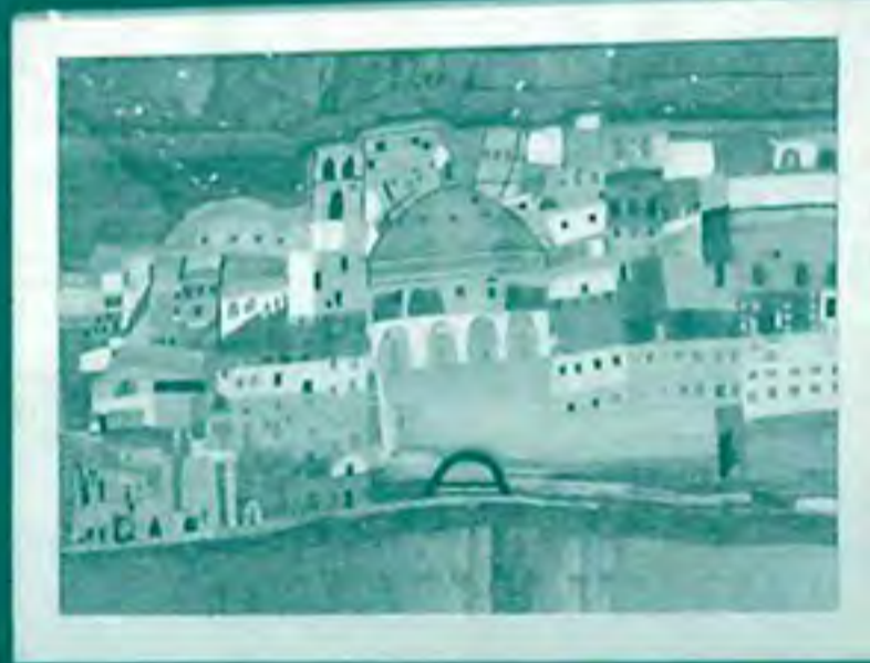
【県知事賞金賞】 作品名: 欧風の建物 作者名: S・K(だいたう作業所)