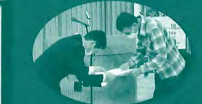
金賞を頂きました(#^^#)