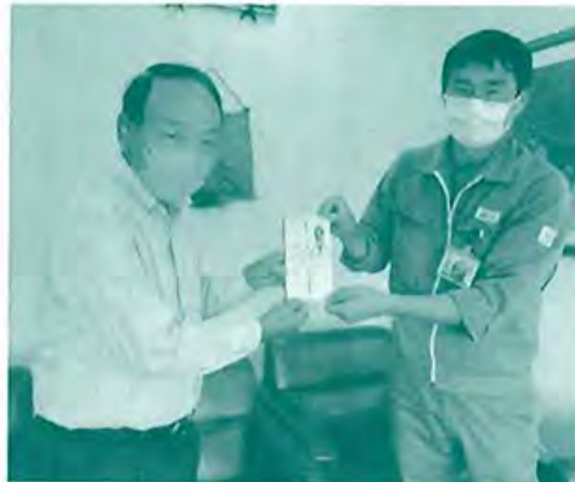
ミクニ労働組合様