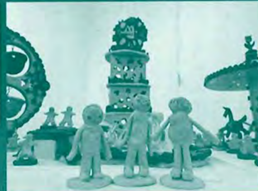
【県社会就労理事長賞銀賞】 作品名: きもためし 作者名: T・N(り〜どくさぶえ)