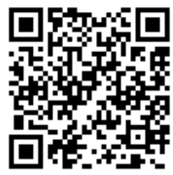
東遠地区施設連絡会 ホームページQRコード http://www.toen-igwf.net/