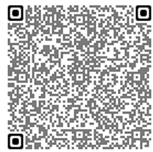
菊川市アエル地図QRコード