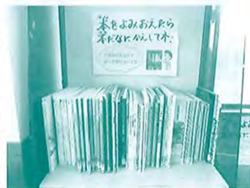
返却ルールでみんなが楽しめるように...

利用者さんの休憩時や待ち時間の過ごし方の選択肢の中に「読書」があってもいいな、と思い始めた試み。毎日、熱心にページをめくる方や、絵画のモチーフに使われる方等、様々な本との関りを見ることが出来ます。今後も「文化の香る共同作業所」を目指し、施設環境を整えていきたいと思っております。是非一度ご覧にお越しください!