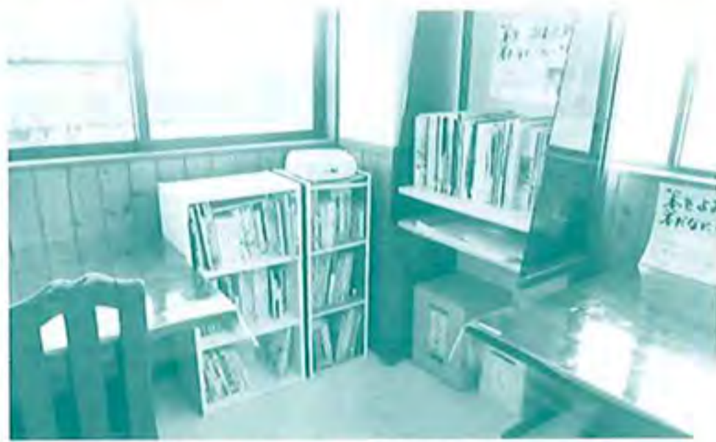
食堂に「ちょこん」とあります

草笛共同作業所の2階にある食堂の片隅に、小さな図書室があります。2年前より開設し、少しずつ蔵書を増やしていきました。職員の家で眠っていた本や、近隣の図書館から無償で頂いた絵本や美術書、雑誌などを中心に現在約300冊を所蔵しています。