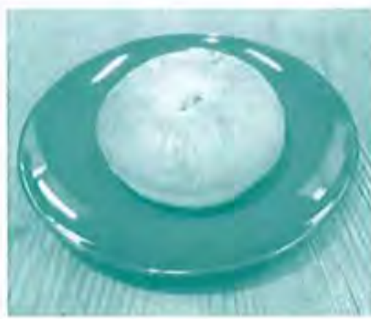
試行錯誤のうえ完成した「酒粕あんパン」

草笛共同作業所では酒かすを使用した「酒粕あんパン」をイベント限定で製造し、人気のある草笛パンとのセット販売を致しました。参加された利用者さん・有償ボランティアさんさんの力を得て、予定数を早々に完売することができました。また、りくどくさぶえでは酒粕を使った「酒粕餡」を製造・販売し、こちらもご好評頂けた中で多数の販売ができましたこと、お礼申し上げます。