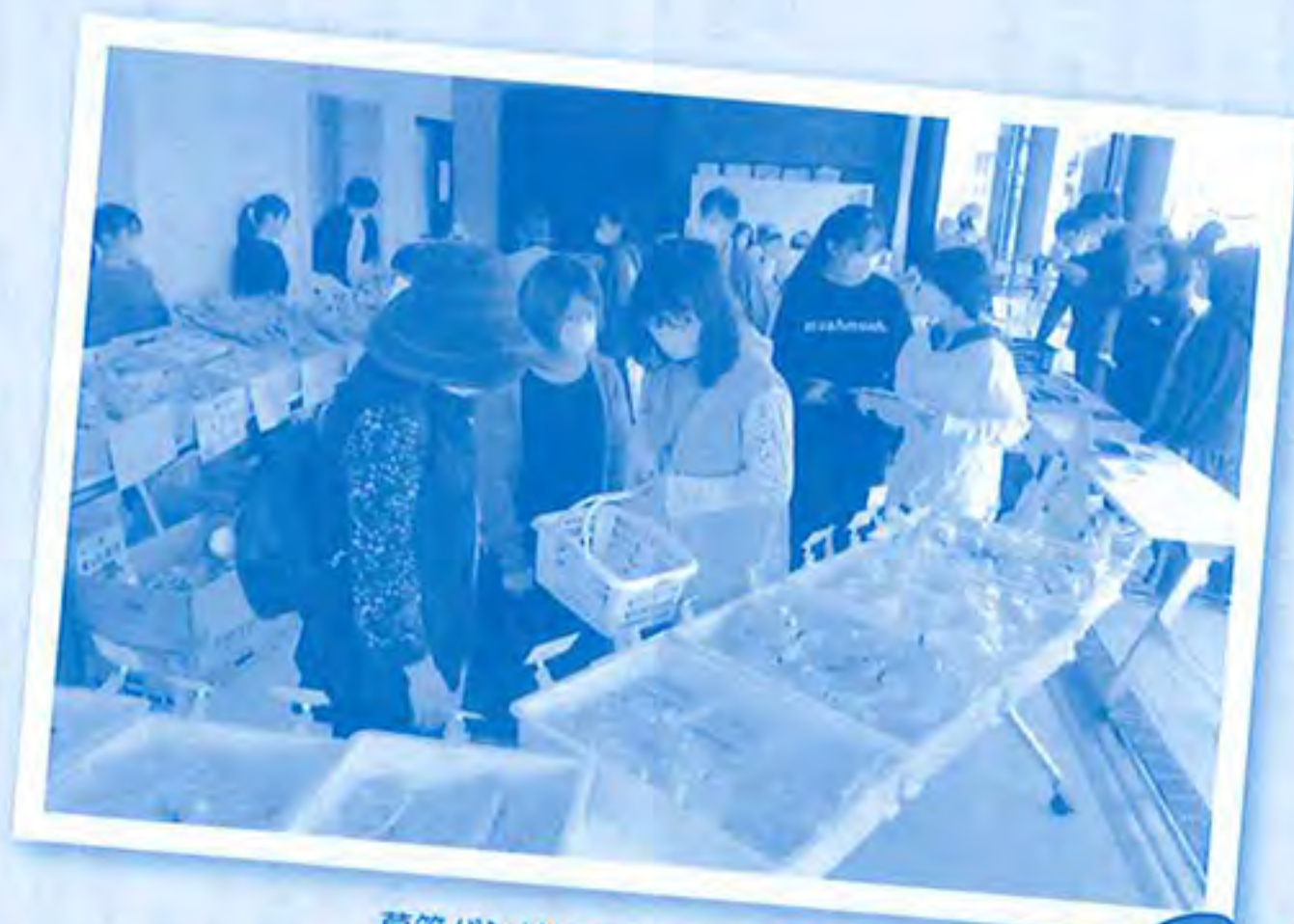
草笛パンはいつも大盛況です。今回はり〜どくさぶえの生シイタケも出品しました。

草笛の会の皆さんと交流をすることで改めて共生社会の大切さを感じることが出来ました。皆さんが明るく話しかけて下さったので話しやすかったです。様々な方と交流するこ