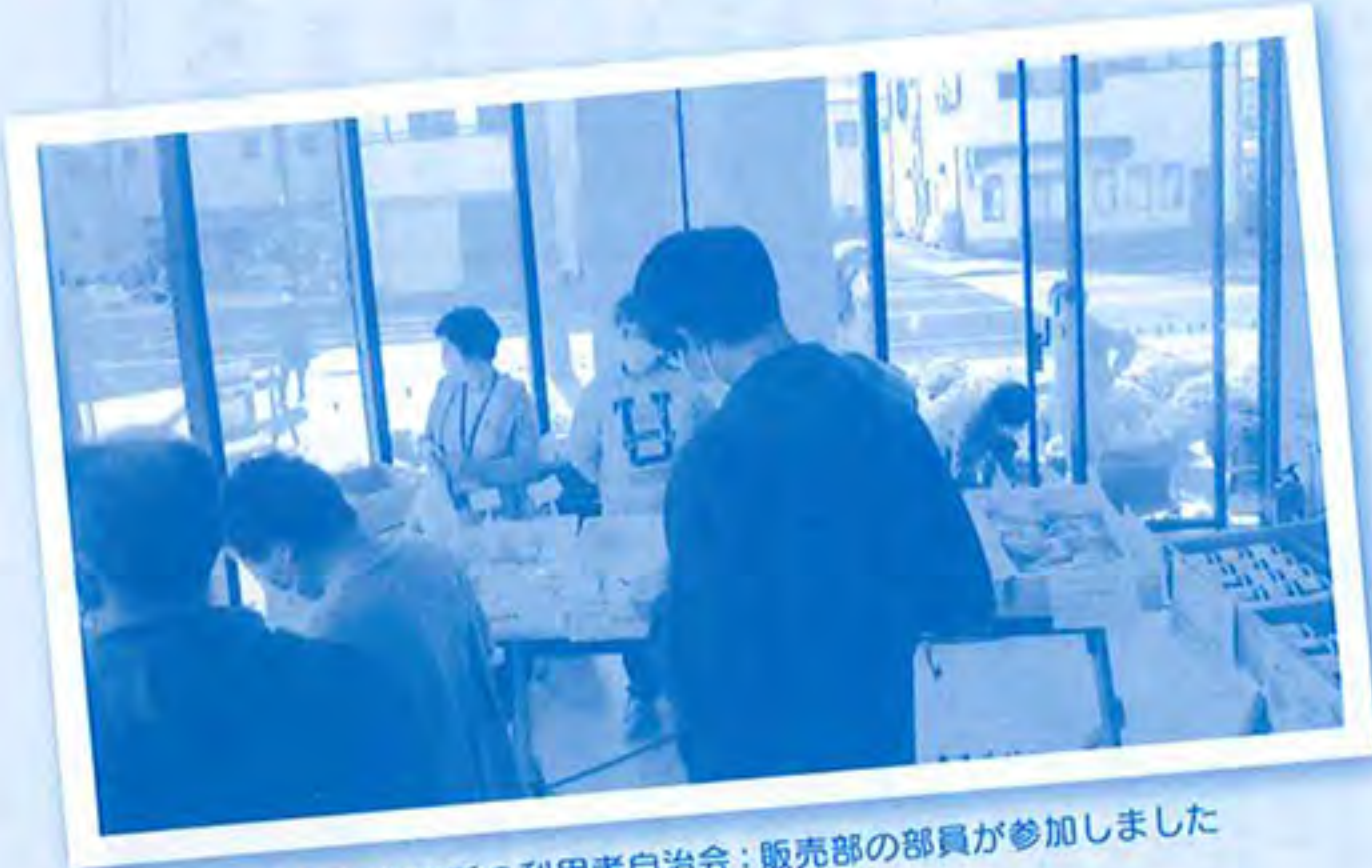
草笛共同作業所の利用者自治会：販売部の部員が参加しました

小笠高生との小さな収穫祭が、開催され待ち焦がれていた利用者さんと共に張り切って参加して参りました。活動の様子や小笠高生の感想などを一部紹介させて頂きます。コロナ禍での活動の制限、生様式の変化があり、人が集まるイベントでの販売が難しい場面が多くなってきましたが、そのマインスのエネルギーを吹き飛ばすように元気に明るく力強く活動してくれる、又そこに巻き込んでくれる若いエネルギーに感謝すると共に、一緒に参加できる喜びを利用者さん職員共に感じています。