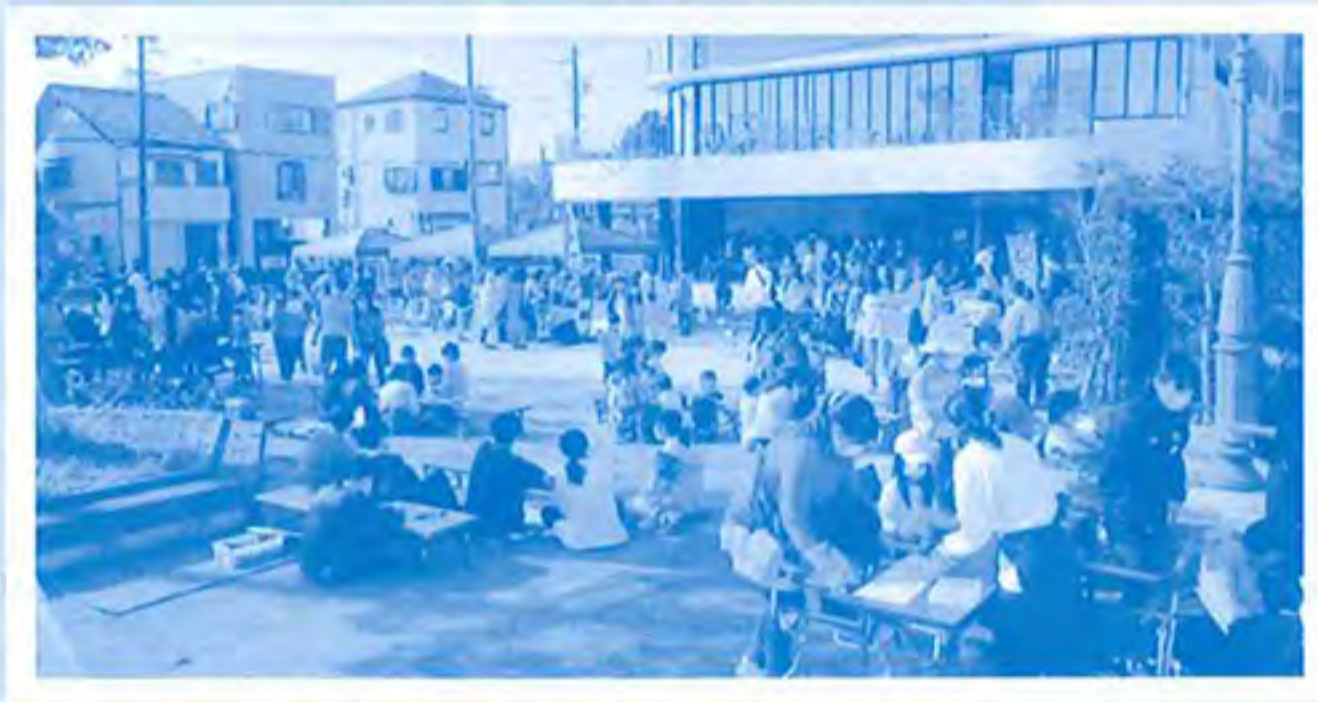
野外では、常葉菊川高校によるイベント「アソビバ」に多くの来場者が見えました。

小さな収穫祭にて草笛の会の方々とパンを販売し、親交を深めることが出来ました。一緒に販売することで、来ていただいたお客様にも丁寧に説明することができ、喜んで購入してもらいました。親交を深めていくことで、相手の方を理解し、その方にあった対応をすることが出来ました。たくさんの方々と交流をしていくことは地域の繋がりを強くし、地域の活性化にも繋がるので、今後もこのような活動を続けていきたいです。