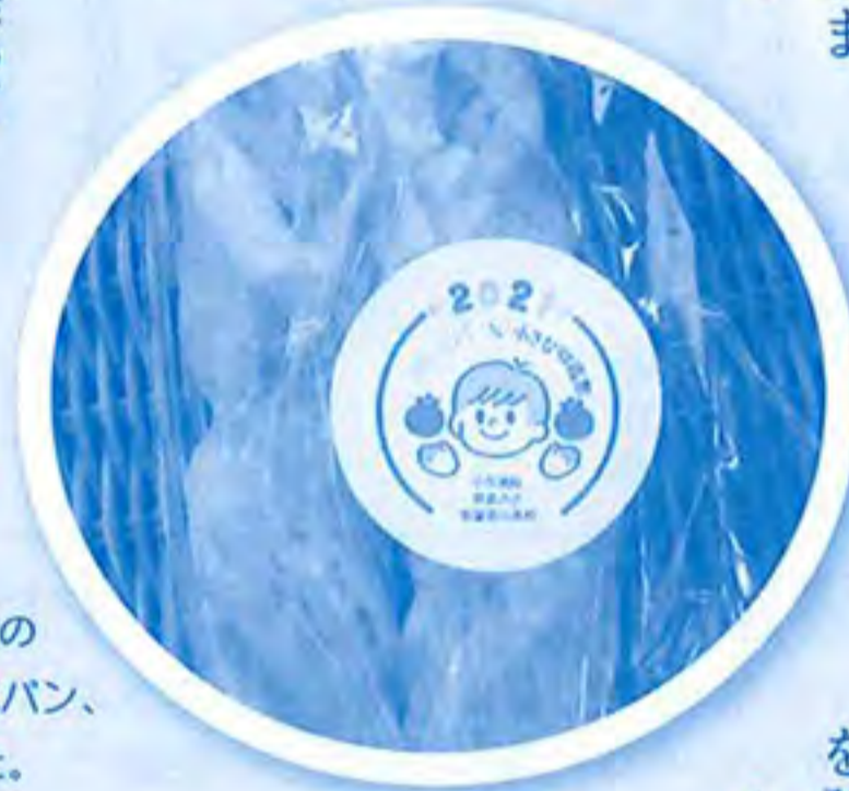
小笠高校で作った「トマトジャム」を、生徒さんのレシピを使い草笛パン工房が焼き上げたコラボパン、「トマトジャムパン」を今回初めて出品しました。