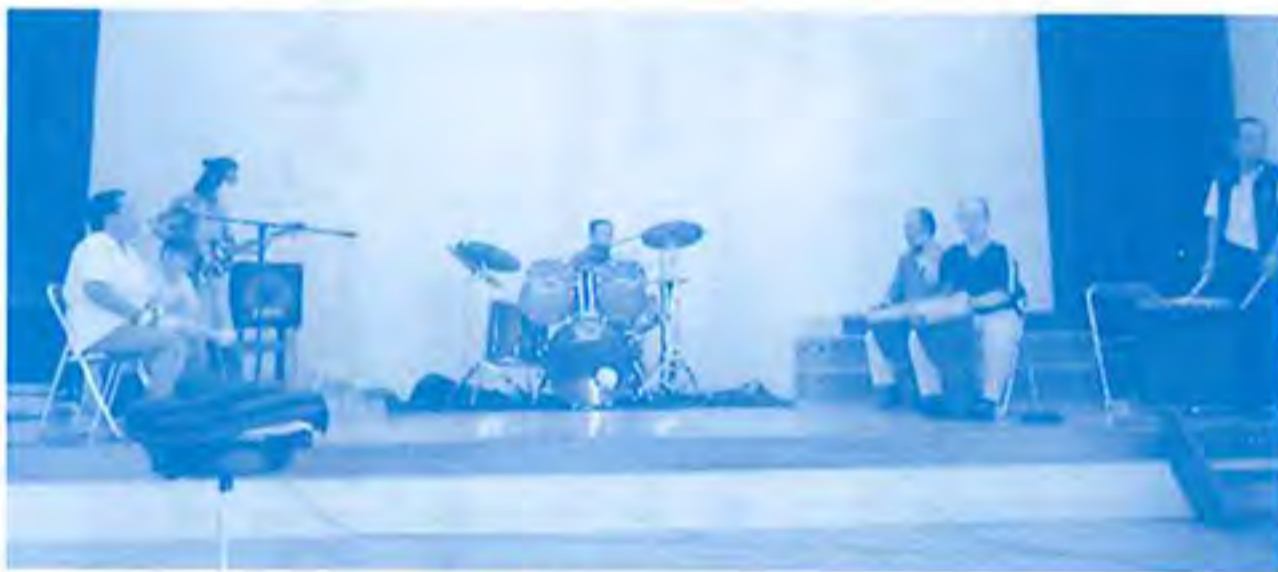
体育館での「草笛バンド」練習風景