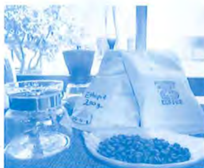
好評販売中:自家焙煎コーヒー豆