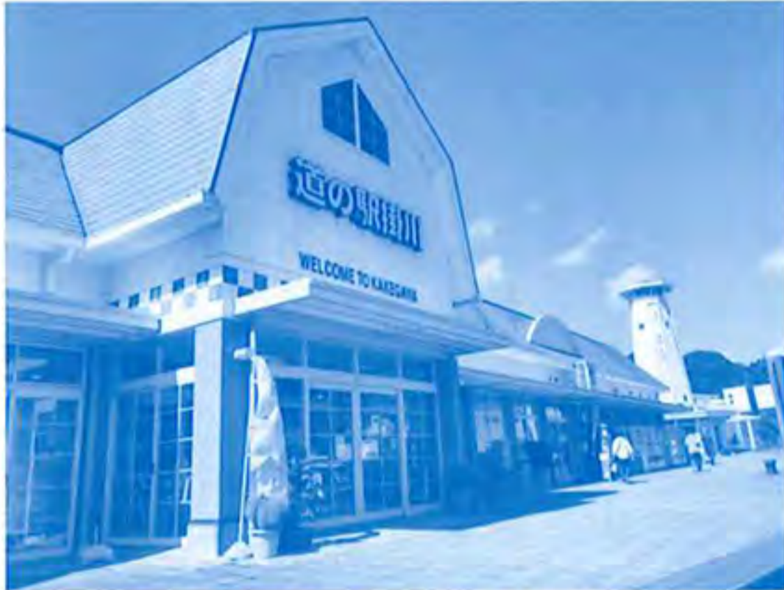
国道1号線日坂バイパス沿いにある「道の駅 掛川」