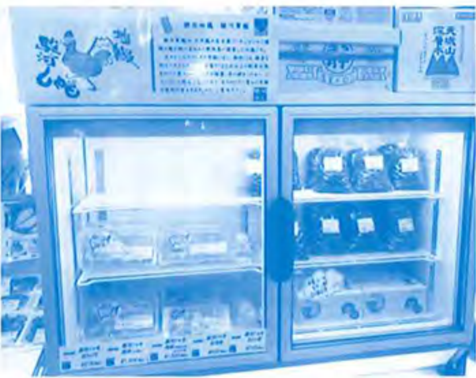
「道の駅 掛川」でも食肉の販売を開始（全て冷凍商品）