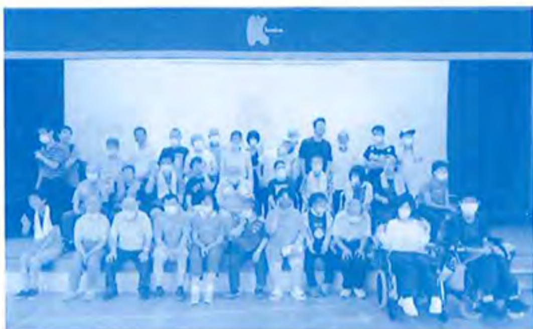
レクリエーションの後、みんなで...