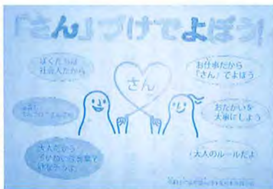
「目標」はポスターとなり掲示されます

で選ばれた自治会長を先頭とした役員会の下に、賞賛部、生活保健部、販売部、環境部を配し、それぞれの立場から意見を出し合う中でより過ごしやすい環境を利用者さん自ら作り上げていく場として機能しています。月1回開催される利用者全体会議ではその時々々の議題を話し合ったり、作業所全体の目標を立てたりしています。一人でも多くの利用者さんの意見をうかがえるよう、職員も工夫して支援をさせていただいています。この自治会が草笛共同作業所の日々の原動力となっています。