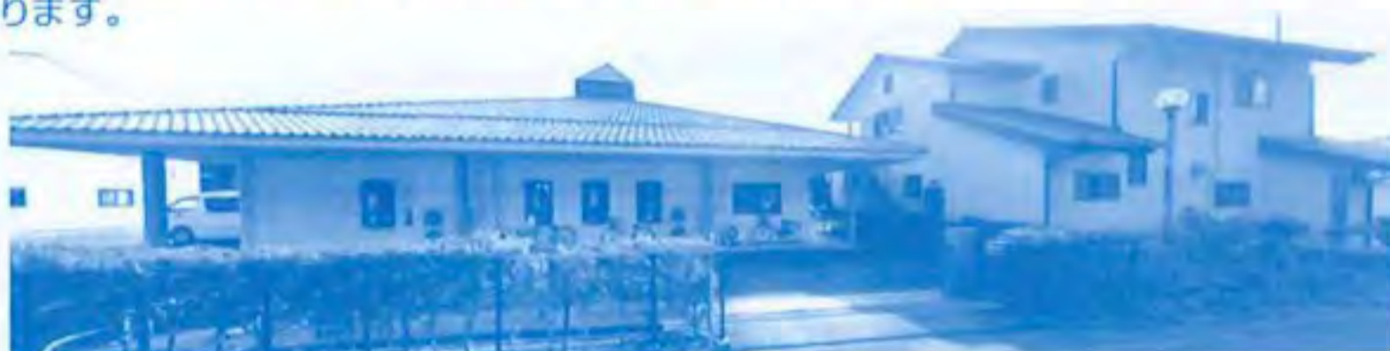
↑就労継続支援事業B型