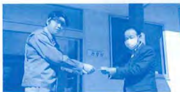
ミックニ労働組合様