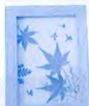
押し花 額(大) 500円