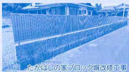
たかはしの家ブロック塀改修工事