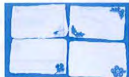
カード 1枚 100円