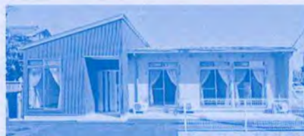
つばきの家建築工事

この度、社会福祉施設整備事業及び助成事業が完了いたしましたので、ご報告させていただきます。また、補助金及び助成金の交付をいただきました、静岡県、菊川市、御前崎市、静岡福祉協議会の皆様には厚く御礼申し上げます。