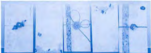
のし袋 1袋 250円

再生紙は牛乳パックを再利用しています。デザイン等のご希望がございましたら、「草笛の会 かすが」までお問い合わせください。