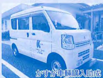
かすが車輛購入助成