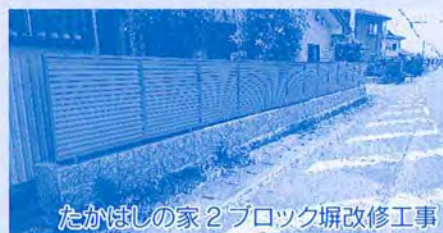
たかはしの家2ブロック塀改修工事