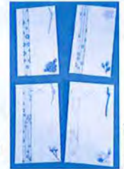
ポチ袋 1袋 100円