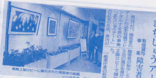
「まちじゆうアート」PR 有償写真 障害者の絵画展示 県庁

発行の「地域交流誌」えんまる」の表紙絵掲載も4年目を迎えます。これらの作品は一朝一夕にできたものでなく長年にわたる専門的・継続的な支援の結果でもあります。これらも利用者の個性を生かしたアート作品の支援を草笛の会の伝統として行っていければと考えています。