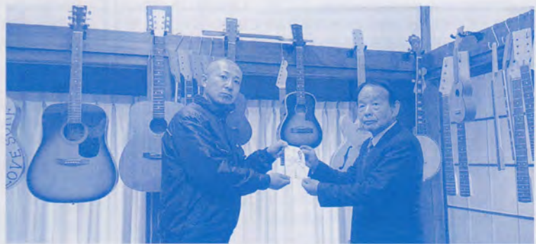
ミックニ労働組合様